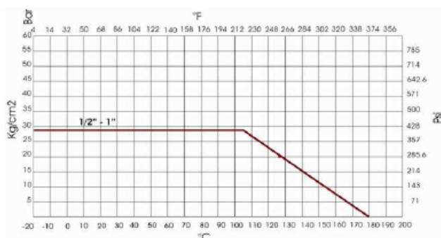
DIAGRAMME DE TEMPÉRATURE ET PRESSION